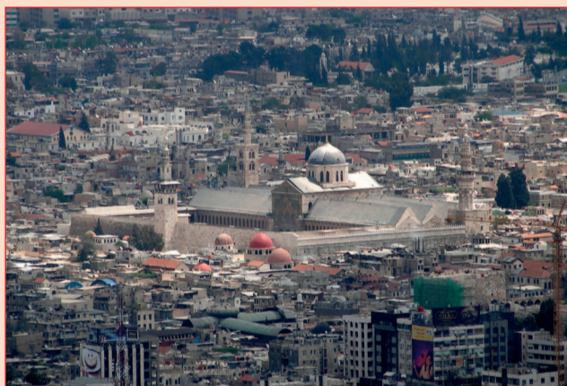
Столица Сирии Дамаск в наши дни

Исаия призывал царя Иудеи Ахаза возложить упование на Бога и не сомневаться в том, что Изра-