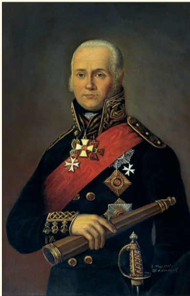
Адмирал Фёдор Ушаков. Пётр Бажанов, 1912 г.

Его канонизировали не за государственные заслуги, а за то, что в центр своей личной жизни он ставил евангельские идеалы, следуя им в меру сил и возможностей. Фёдор Ушаков сочетал свой высокий воинский чин с глубоким смирением, неподдельной скромностью и искренней верой.