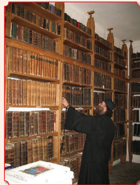
Библиотека Нямецкой лавры самая крупная из всех монастырских книгохранилищ Румынии

Она насчитывает 22 тысячи печатных и рукописных книг, среди которых – более тридцати рукописей, написанных самим прп. Паисием Величковским и содержащих его многочисленные правки. Переводы святого Паисия с греческого на церковно-славянский долгое время были единственными в Малороссии и всей Российской Империи и читались повсюду. Среди них: сборник «Добротолюбие», сочинения преподобного Исаака Сирина, Федора Студита, преподобных Варсонофия и Иоанна, святителя Григория Паламы, преподобного Максима Исповедника, святителя Иоанна Златоуста и многие другие. Еще одна жемчужина книгохранилища – Евангелие, подаренное российской императрицей Екатериной II. Книга имеет внушительные размеры и весит около 35 килограммов.