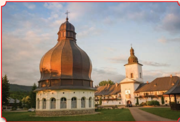
Напротив колокольни и святых врат обители расположены агиасматар и колодец

году жизни, Паисий был рукоположен в иеромонаха. При увеличении числа своей братии, по их просьбе, Паисий испросил у Пантократора старую келию пророка Илии и приступил к устройству скита пророка Илии, став основателем одного из крупнейших скитов на Афоне. Кафоликон (главный храм – прим. ред.) скита был построен в 1903 году. В настоящее время скит принадлежит монастырю Пантократор