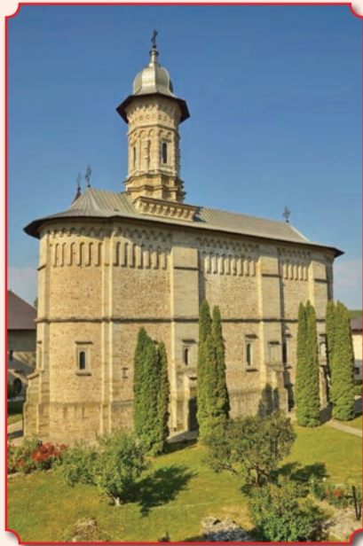
Церковь монастыря Драгомирна, освященная в 1609 году в честь Сошествия Святого Духа

По причине военного противостояния между Россией и Турцией, в которое были вовлечены и греческие монахи Афона, преподобный решил уйти вместе со своей братией в Молдовалахию, где положил труды к совершенствованию местной монашеской жизни. По благословению митрополита Молдавского в Яссах, получил в 1763 году Свято-Духов монастырь в Драгомирне в Буковине, где установил строгий общежительный порядок, причем богослужение совершалось, как и в Ильинском