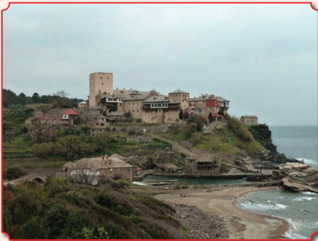
Монастырь Пантократор на Святой горе Афон

нений и создал славянский свод (перевод) «Добротолубия».