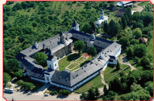
Нямецкая лавра с высоты птичьего полета

Нямецкая лавра была основана в XIV веке и является древнейшей обителью исторической Молдовы. Среди покровителей лавры были такие молдавские правители, как Петр Мушат, Александр Добрый и Стефан Великий. Последний из них прославлен в лике святых и является небесным покровителем молдавских земель. Он мно-