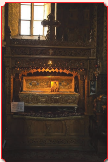
Рака с мощами прп. Паисия Величковского, справа – ковчег с честной главой прп. Симеона Дивногорца

монастырей по всему миру. Сам преподобный оказал значительное влияние на многих православных подвижников России конца XVIII и XIX веков. Св. Серафим Саровский получил благословение на уход в Саров от затворника Китаевской пустыни (под Киевом) старца Досифея, который был духовно связан с обителью преподобного Паисия и направлял туда своих учеников. Сборник «Добротолюбие» был настольной книгой преп. Серафима Саровского.