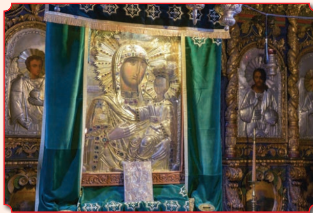
Нямецкая икона Божией Матери

Замечательный список, оклад для которого изготовил лучший в те времена художник по металлу Ф. А. Верховцев, был сделан с чудотворной иконы для новообразованного Ново-Нямецкого монастыря в с. Кицканы. 10 (24 нов. ст.) октября 1864 года список святыни был