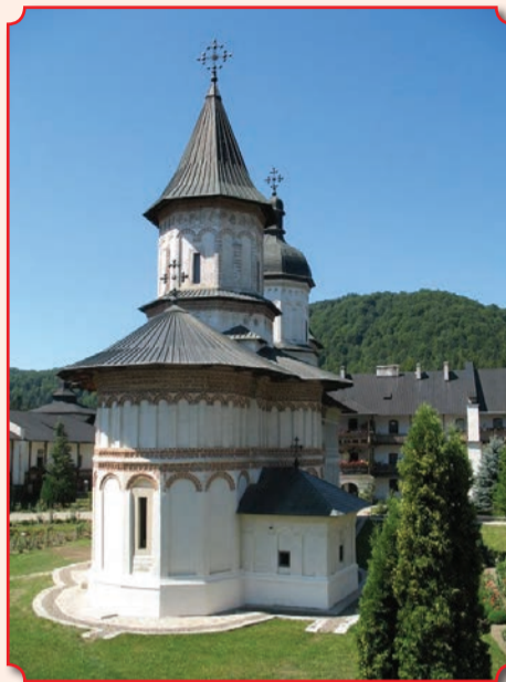
Соборный храм Усекновения главы Иоанна Предтечи (освящен в 1602 году) монастыря Секу

После юный подвижник прожил около трех лет в обителях Молдовалахии, подвизаясь под руководством старцев Васи-