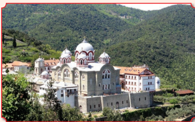
Ильинский скит на Афоне, основанный преподобным Паисием Величковским в 1758 году

году жизни, Паисий был рукоположен в иеромонаха. При увеличении числа своей братии, по их просьбе, Паисий испросил у Пантократора старую келию пророка Илии и приступил к устройству скита пророка Илии, став основателем одного из крупнейших скитов на Афоне. Кафоликон (главный храм – прим. ред.) скита был построен в 1903 году. В настоящее время скит принадлежит монастырю Пантократор