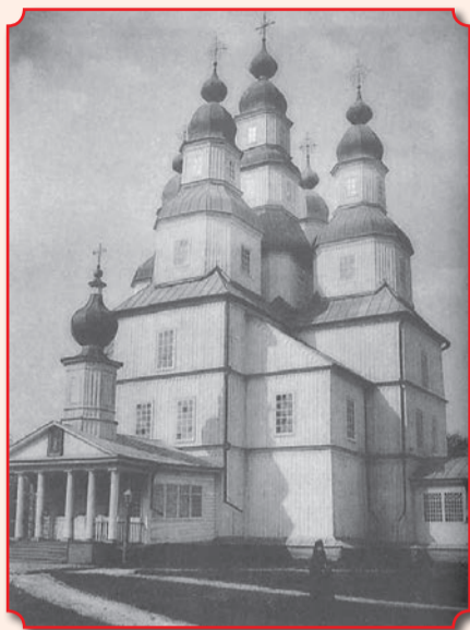
Собор свт. Николая в Медведовском монастыре Чигиринского уезда Киевской губ. Фото 1905 года