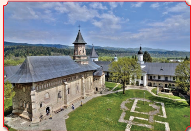
Собор Вознесения Господня и, на заднем плане, храм вмч. Георгия в келейном корпусе

А во времена настоятельства преподобного Паисия Величковского в обители было 1100 монахов 23-х национальностей: греки, русские, румыны, болгары, македонцы и другие. Учениками святого Паисия было основано 110