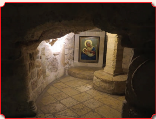
Молочный грот, где Божия Мать скрывалась от воинов царя Ирода

За армянским монастырем, который, как и католический, входит в ансамбль базилики Рождества, начинается небольшая улица Молочной пещеры. Пройдя по ней около 300 м, можно увидеть справа вход