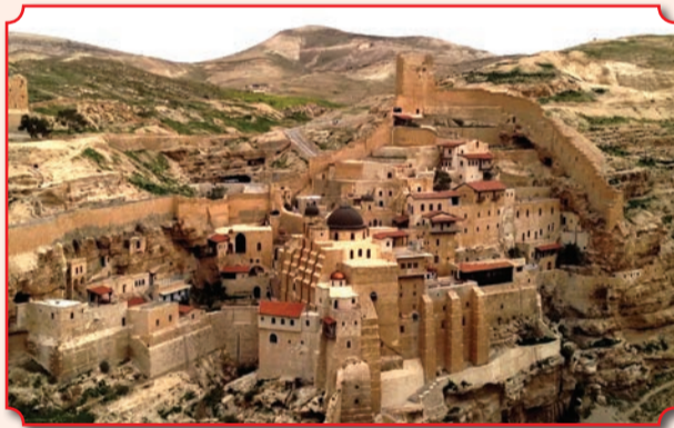
Лавра Саввы Освященного

В окрестностях Вифлеема находятся известные во всем православном мире Лавра Саввы Освященного и Монастырь Феодосия Великого. Лавра прп. Саввы расположена на территории пустыни Иудейской, в долине Кедрон. Ее другое название – монастырь Мар-Саба. Основан он был около 484 года преподобным Саввой Освященным и является одним