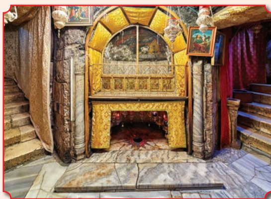
Главная святыня Вифлеема – место Рождества Христова в пещере под амвоном греческого храма

Вифлеем не был родным городом ни для Божией Матери, родившейся, по одной версии, в Назарете, по другой, – в Иерусалиме, ни для Ее обручника Иосифа, жившего в Назарете. В Вифлеем, как в город своего предка Давида, они пришли, согласно евангелисту Луке, чтобы участвовать в переписи населения Римской империи, в