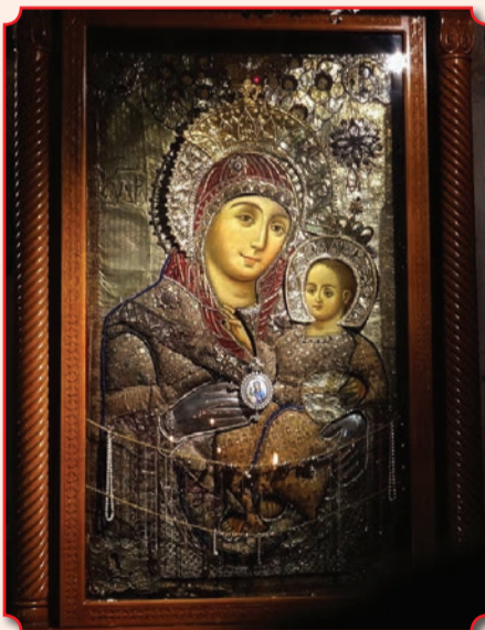
Вифлеемская икона Пресвятой Богородицы

В нескольких метрах справа от спуска в пещеру Рождества, у стены, в деревянном киоте находится чудотворная Вифлеемская Божией Матери. Лик Пречистой Девы Марии на этом образе озарен улыбкой, Богородица радуется рождению Сына, Спасителя мира. Вместе с ней, глядя на образ, радуются все, входящие в храм. В левой руке Божественного Младенца изображена держава, символ царственной власти, правой Он благословляет молящихся. Икона эта русского письма. Есть предположение, что она была пожертвована в базилику Рождества Русским императорским домом. Считается, что образ был передан императрицей Елизаветой Петровной, когда она исцелилась перед ним от тяжелой болезни. По другой версии,