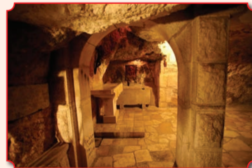
Гробница и барельеф блж. Иеронима Стридонского в пещере, где он провел последние 32 года жизни

К базилике Рождества примыкает, образуя один архитектурный ансамбль, католический храм и монастырь св. Екатерины, построенный в 1881 году архитектором Гийемо на месте августинского монастыря XII века, который стоял на месте византийского монастыря V века, основанного ученицами блж. Иеронима Стридонского св. Паулой и ее дочерью св. Евстохией. С правой стороны нефа лестница ведет вниз, в пещеры Вифлеемских младенцев и блж. Иеронима, которые соединяются проходом с пещерой Рождества Христова. С I века они использовались христианами в качестве мест погребения, в них находятся гробницы св. Паулы и самого блж. Иеронима. Этот святой отец особенно почитается на Западе, но память его читается и православными. Им были написаны исследования Священного Писания, исторические сочинения, богословские трактаты. Самое большое достижение блж. Иеронима в том, что он перевел Священное Писание с древнееврейского на латынь, составив перевод, известный нам как «Вульгата».