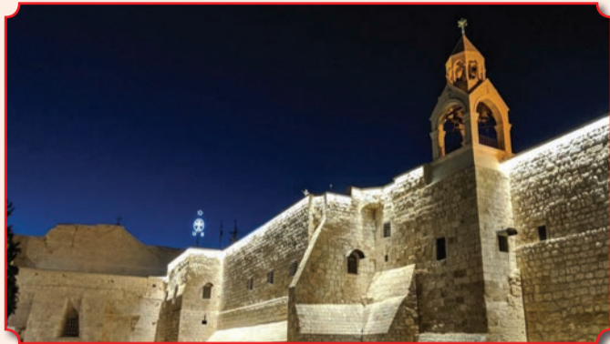
Базилика Рождества Христова в Вифлееме

«Дом мяса». Исконное еврейское название – Бейт Лехем – переводится как «Дом хлеба». Еврейское название – дохристианское, арабское – по случайному созвучию. Но оба оказываются прочесными: ведь здесь родился Агнец Божий, закланный за грех мира, – Христос, Хлеб Жизни.