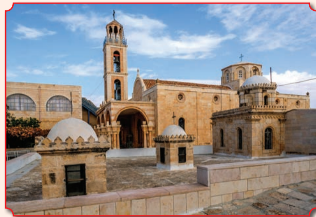
Монастырь Феодосия Великого

Монастырь Феодосия Великого – первый в Палестине общежительный монастырь. Расположен в 7 км к востоку от центра Вифлеема, в Иудейской пустыне, на территории Западного берега реки Иордан. Ныне – православный греческий женский монастырь в подчинении Иерусалимской патриархии. Основан в 476 году Феодосием Великим около пещеры, где, согласно преданию, приходившие на поклонение Христу волхвы останавливались на отдых на обратном пути (Мф. 2, 12). Посвящен Пресвятой Богородице. В отличие от Лавры Саввы Освященного, которая ни на день не закрывалась, Монастырь Феодосия Великого существовал до начала XVI века, когда был razoren турками, после чего долгое время был в запустении. В 1898 году Иерусалимская патриархия выкупила этот участок земли и занялась реконструкцией, которая шла с 1914 по 1952 годы. Сама пещера волхвов сохранилась и содержит гробницы Иоанна Мосха и других святых, в том числе самого преподобного Феодосия Великого.