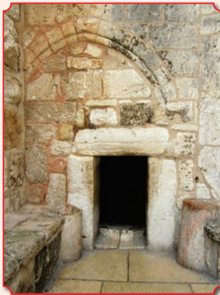
«Врата смирения», через которые входят в базилику, смиренно склонившись

Базилика Рождества была заложена святой императрицей Еленой во время ее паломничества в Святую Землю в середине 320-х годов, но была почти уничтожена пожаром в 529 году в ходе Самаритянского восстания, о чем свидетельствуют результаты археологических раскопок 1934–1936 годов. В целом Вифлеемская базилика повторяла общие черты храма Гроба Господня. В современном здании от нее лучше всего сохранились полы. В период правления благоверного императора Юстиниана Великого преподобный Савва Освященный направил ему прошение о восстановлении базилики. Построенный Юстинианом храм не пострадал во время персидского нашествия (612–629 годы), при завоевании города халифом Аль-Хакимом в 1009 году базилика также не пострадала, так как мусульмане почитали место рождения Христа (южный трансепт храма был ими отделен и использовался как мечеть). Но в конце