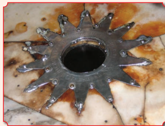
Место рождения Сына Божия отмечает серебряная звезда с 14-тью лучами

которую в те времена входила провинция Иудея. Рождение Мессии в Вифлееме было предсказано пророком Михеем более чем за семь веков до самого события: «И ты, Вифлеем-Ефрафа, мал ли ты между тысячами Иудиными? Из тебя произойдет Мне Тот, Который должен быть Владыкою и Которого происхождение из начала, от дней вечных» (Мих. 2, 5). Но для Матери Сына Божия не нашлось места под кровом жилищ, и родила Она Предвечного Бога в пещере, где пастухи укрывали от непогоды скот.