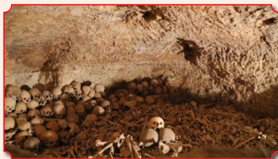
В пещере Вифлеемских младенцев покоятся и кости христианских мучеников, погибших в 614 году при нашествии персов

из древнейших общежительных монастырей. К концу жизни святого Саввы в основанном им монастыре проживало до 5000 иноков. В VIII веке в лавре принял монашеский постриг и прожил около 50 лет святой Иоанн Дамаскин, сохранились пещера, в которой он жил, и его гробница. В монастыре есть усыпальница, в которой хранятся мощи монахов, убиенных при нашествии персов в 614 году. Мощи основателя обители прп. Саввы покоятся здесь же. В 1256 году его мощи тайно были вывезены католиками в Венецию, и только в 1965 году папа Римский Павел VI по просьбе патриарха Иерусалимского Венедикта вернул мощи в обитель. Лавра Саввы Освященного – одно из немногих мест, куда не добрался прогресс. Монахи сознательно отказываются от многих благ цивилизации. Так, например, электричество в Лавру не проводят и в наши дни, монахи пользуются свечами и керосиновыми лампами. За все шестнадцать веков, что существует Лавра, в нее ни разу не ступала женская нога.