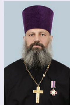
Протоиерей Стефан Иволга