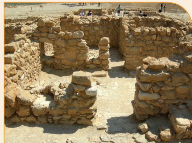
Раскопки в Кумране

Тишина и безлюдность окружающей Мертвое море пустыни, вызывающие чувство религиозного благоговения и лучшим образом готовящие человека к встрече с Богом, привлекали в эти места подвижников веры на протяжении более двух последних тысячелетий. Труднодоступные и изобилующие пещерами возвышенности вдоль западного берега Мертвого моря служили местом проживания еврейской религиозной общины ессеистского типа, практиковавшей отшельнический образ жизни. Религиозная община ессеев являла собой одно из течений тогдашнего иудаизма.