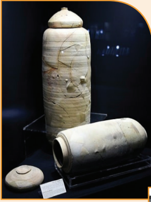
Глиняные кувшины, в которых хранились свитки

каждого православного человека было великим событием, благословляющим всю его дальнейшую жизнь. Страна, Божиим Промыслом ставшая место земной жизни, Крестной смерти и Воскресения Господа нашего Иисуса Христа, уже две тысячи лет влечет к себе паломников как никакое другое ме-