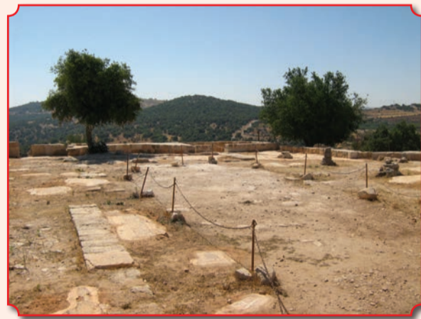
На вершине холма Тель-Мар-Ильяс сохранились остатки двух храмов византийской эпохи

В канун праздника Богоявления (Крещенский сочельник), 18 января, река Иордан освящается с двух сторон. Первым совершает чин Великого освящения воды Иерусалимский Патриарх в присутствии архиереев, клириков Иерусалимской Церкви и многочисленных паломников. После окончания чина освящения воды при пении тропаря праздника Богоявления Патриарх, по традиции, выпускает в небо трех белых голубей в память о схождении Святого Духа на Христа в виде голубя: «И глас был с небес: Ты Сын Мой возлюбленный, в Котором Мое благоволение» (Мк. 1, 10-11). Белые птицы потом долго кружат над священными водами Иордана. На противоположном берегу освящение воды совершает архиепископ Аммана, представляющий также Иерусалимский Патриархат. По свидетельствам очевидцев, при освящении реки Патриархом случается чудо: течение Иордана на некоторое время разворачивается в противоположном направлении. Все, кто сподобился этого дивного видения, вспоминали слова псалмопевца Давида: «Море виде и побеже, Иордан возвратился вспять» (Пс. 113, 3).