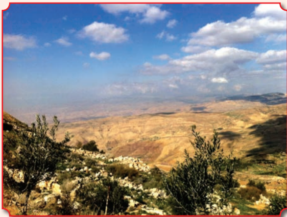
Панорама, которую созерцал с горы Невó перед смертью пророк Моисей больше трех тысячелетий назад

Моавитских на гору Невó, на вершину Фасги, что против Иерихона, и показал ему Господь всю землю Галаад до самого Дана...» (Втор. 34, 1). Там он и умер. На вершине горы находится «Мемориал Моисея» – согласно Библии, он «погребен на долине в земле Моавитской против Беф-Фегора, и никто не знает [места] погребения его даже до сего дня» (Втор. 34, 6). Как говорят святые отцы, Господь скрыл место погребения Моисея, чтобы евреи не смогли обожествить его и не стали поклоняться его телу.