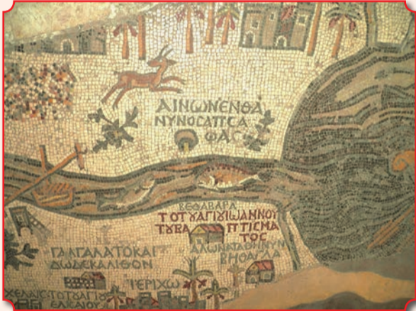
На мозаичной Мадабской карте – древнейшей карте Святой Земли – обозначен Енон, где крестил народ св. Иоанн Предтеча

В Евангелии от Иоанна упоминается Енон – одно из мест, где святой Иоанн Предтеча крестил народ, «потому что там было много воды» (Ин. 3, 23). Енон можно найти на самой древней карте Святой Земли – карте из Мадабы, созданной византийскими масте-