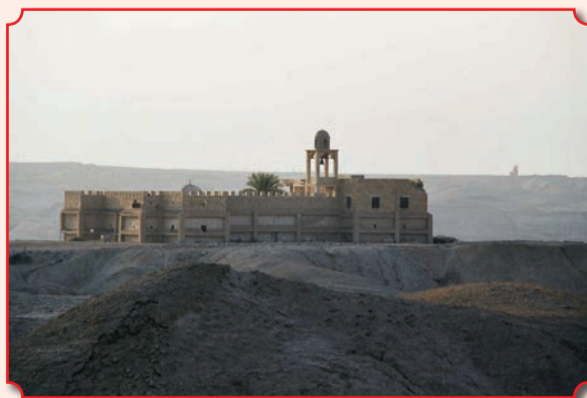
Находящийся рядом с Каср-эль-Яхуд православный монастырь Иерусалимской Православной Церкви, имеющий вид замка

Каср-эль-Яхуд – предполагаемое место Крещения Христа на израильском берегу Иордана, где каждый год Иерусалимский Патриарх 18 января совершает Великое освящение воды. Рядом с Каср-эль-Яхуд находится древняя дорога и речной брод, соединяющий Иерихон и несколько библейских мест, таких как Мадаба и гора Невó. Находящийся рядом православный монастырь св. Иоанна Предтечи, принадлежащий Иерусалимской Патриархии, имеет вид замка, а по преда-