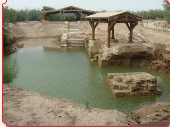
Возможно, именно на этом месте принял Крещение Господь наш Иисус Христос

кает ручей Вади-эль-Харрар, в 1996 году начались археологические раскопки, в ходе которых были обнаружены остатки нескольких древних храмов и мраморная плита, на которой, как предполагают, стояла колонна с крестом, установленная во времена раннего христианства на месте Крещения Господня. Именно эта колонна часто упоминается в письменных источниках паломников византийской эпохи, посетивших Святые места. И хоть сейчас это место не имеет выхода к реке Иордан, которая за два тысячелетия неоднократно меняла русло, остатки византийских построек говорят, что почитаемое оно было как минимум с VI века. В 2015 году местность Вифавара с холмом Илии (Тель-Мар-Ильяс), Эль-Махтасом и археологическими раскопками признана объектом Всемирного наследия ЮНЕСКО.