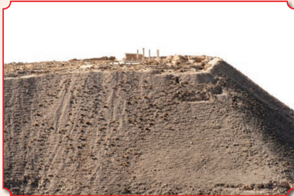
Руины Махерона – крепости и дворца Ирода Великого, где был обезглавлен св. Иоанн Креститель

Последнее место Иордании, о котором получится упомянуть в этом номере и которое, к тому же, имеет некоторое отношение к празднику Крещения Господня, расположено в часе езды от Мадабы, около деревушки Мукавир, за которой находятся руины Махерона – крепости и дворца царя Ирода Великого. Как писал Иосиф Флавий: «Сама крепость образована была скалистым холмом, поднимающимся на чрезвычайную высоту и потому трудно достигаемым, но природа еще позаботилась о том, чтобы он был недоступен. Со всех сторон холм окружен невероятной глубины пропастями, так что переход через них практически невозможен» (Иудейская война, кн. VII, гл. 6, 1). Но в историю она вошла не как неприступная крепость, замечательная в военном отношении, а как тюрьма, где содержался и был казнен св. Иоанн Предтеча. Проповедь Иоанна Крестителя, клеймившего отвратительные грехи сановников Израиля, не исключая и самого царя, внушила ужас Ироду Антипе и его незаконной жене Иродиаде. Однако царь страшился отдать приказ убить пророка. Ирод Антипа повелел заточить Иоанна в неприступную крепость Махерон. Но даже находясь в столь страшных условиях, св. Иоанн не был сломлен. И сама казнь не заставила его умолкнуть. По преданию, отсеченная голова Иоанна Крестителя еще раз обличила царя Ирода Антипу словами: «Ирод, не должно тебе иметь жену брата твоего!»