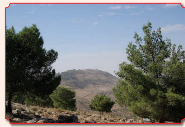
Гора Невó, с которой Моисей увидел Землю Обетованную

место Крещения Господа Иисуса Христа со стороны Иордании, то стоит отправиться и на расположенный в 8 км к северо-западу от иорданского города Аджлуна, в 1 км от развалин селения аль-Иштиб (Листиб, Фесвия Галладская), которое традиционно соотносится с местом рождения святого пророка Божия Илии, холм Тель-Мар-Ильяс (с араб. – «холм святого Ильи»). Этот холм считается местом, где пророк Илия был вознесен на небеса в огненной колеснице. В 1999 году в районе Тель-Мар-Ильяс были произведены археологические раскопки, в ходе которых были обнаружены развалины огромной церкви, посвященной пророку Илии и датируемой концом VI – началом VII века. Площадь церкви, полы которой были устланы цветными мозаиками, составляет 1340 м².