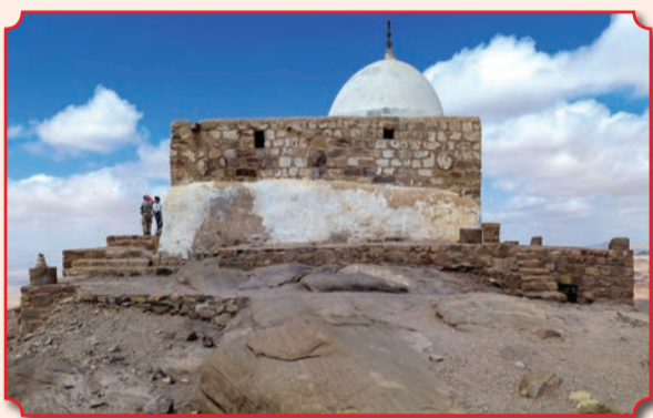
Исламское святилище XIV века над могилой Аарона на вершине горы Аарона (Джабаль-Харун)

Сам Моисей, как и его брат Аарон, в Землю Обетованную не вошли из-за греха, совершенного ими у вод Меривы в Кадесе – Бог дал ему указание взять жезл и сказать скале, чтобы она дала воду, но вместо этого он ударил в нее два раза своим жезлом, проявив тем самым недоверие Богу и Его слову (Чис. 20:7-12). На вершине горы Невó сохранились древние мозаичные