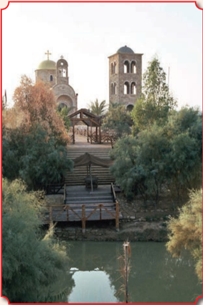
Вифавара. Вид с израильского берега на Эль-Махтас с греческим православным храмом св. Иоанна Предтечи

Вифавара («Бейт Аварá» с иврита – дом переправы, место брода) – название места на реке Иордан, где Иоанн Предтеча совершил Крещение Иисуса Христа, а также где Иоанн проповедовал и совершал крещение в воде и где произошло призвание Иисусом апостолов из учеников Иоанна (Ин. 1:28-51). Существуют несколько версий отождествления Вифавары с местом Крещения Спасителя. Наиболее принятая связывает это название с местностью на берегу реки Иордан на территории современных государств Израиль и Иордания, в 8,6 км к северу от впадения реки Иордан в Мертвое море. При этом на точное место крещения претендуют два археологических памятника – место на западном берегу Иордана, находящееся в ведении Израиля и называющееся Каср-эль-Яхуд, и место на восточном, иорданском, бе-