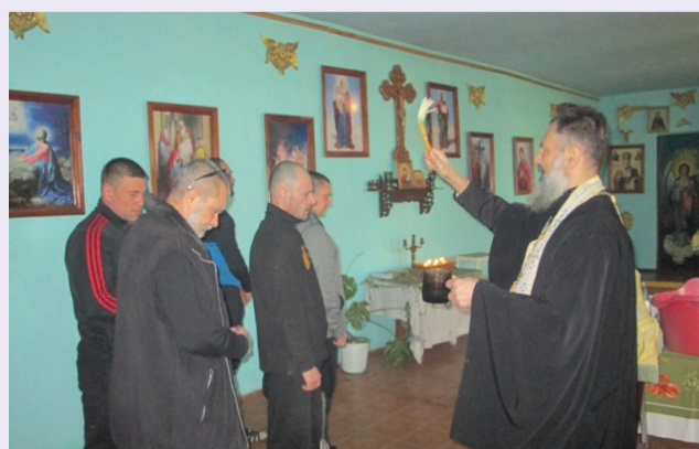
Крещение Господне в УИН-2

Тираспольско-Дубоссарской епархией организуется регулярное общение с насельниками и персоналом ЛТП с. Карагаш, проводятся беседы и совершается Таинство исповеди. Стараниями прихожан и духовенства Слободзейского благочиния насельникам ЛТП оказывается посильная поддержка: для их нужд передаются сладкие подарки, средства личной гигиены, одежда и литература.