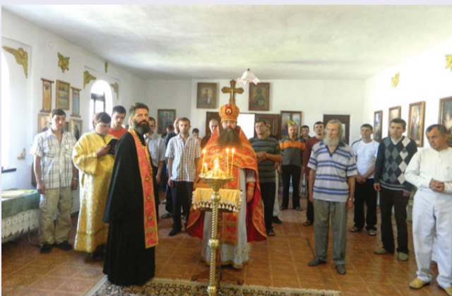
Богослужение в храме святых Царственных страстотерпцев при УИН-2

Началась подготовительная работа по введению института пенитенциарных священнослужителей (капелланов) в учреждениях ГСИН. Достигнуто принципиальное согласие на это руководства ГСИН, однако отсутствие средств в бюджете республики пока не позволило ввести должности капелланов в УИН.