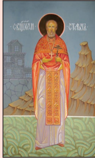
Икона сщмч. Стефана (Костогрыза). Фрагмент росписи Христо-Рождественского кафедрального собора г. Тирасполь.

Пик самой страшной волны репрессий пришелся на период с июля 1937 г. по осень 1938 г. Именно в это время была репрессирована основная часть православных священно- и церковнослужителей. И если в более ранние годы приговоры им выносились сравнительно мягкие – тот или иной срок в исправительно-трудовых лагерях или ссылка в северные края, то в конце 30-х годов для большинства арестованных приговор был одинаковым – расстрел.