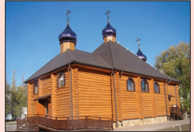
Храм в честь новомучеников и исповедников Церкви Русской г. Тирасполь, воздвигнутый близости от места массовых расстрелов.

Подвиг духовных чад Русской Православной Церкви – и священников, и простых прихожан, которые жизнью своей доказали верность Христу, – должен служить примером для нас, православных христиан XXI века. Эти люди не были героями в обывательском понимании, по большей части не были яркими, исключительными личностями. Свт. Игнатий (Брянчанинов) пишет, что подвиг настоящего христианина часто бывает не ярким и блистательным, а тихим и незамеченным. Но вспомним о том, что войны выигрывают такие армии, в которых солдаты проявляют героизм, доблесть и мужество каждодневно, а не от случая к случаю. То же самое с полным основанием можно отнести и к битвам духовным, где победа зачастую зависит именно от постоянной, кропотливой и внешне невидимой духовной работы.