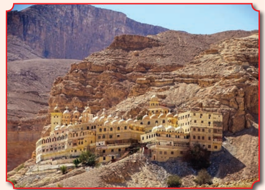
Монастырь святого Павла Фивейского

Однако, как повествует житие прп. Антония Великого, он не был первым христианин подвижником, поселившимся в пустыне. Еще до него этот подвиг на себя принял прп. Павел Фивейский – первый христианский монах и отшельник, проживший, по преданию, 113 лет, из них 91 год в отшельничестве. Монастырь Павла Фивейского – коптский монастырь в Египте, расположенный в 150 км юго-восточнее Каира в Аравийской пустыне, недалеко от побережья Красного моря. История обители восходит к V в., когда был основан монастырь над пещерой, где веком ранее обитал святой отшельник. Первыми насельниками были монахи из Египта и Сирии, предположительно мелькиты. В Средние века монастырь часто подвергался нападениям со стороны бедуинов, но отстраивался. В XVI–XVII вв. более ста лет полуразрушенный монастырь пустовал, пока там не поселились несколько человек из монастыря святого Антония.