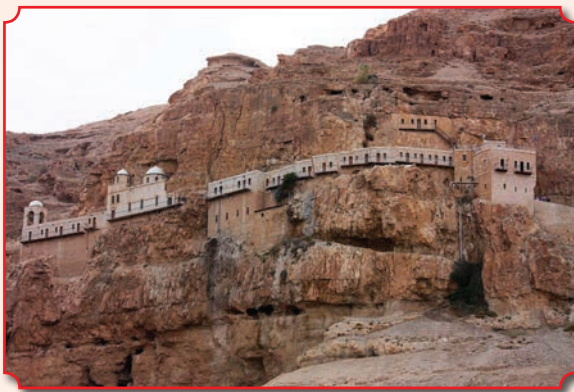
Монастырь Искушения (монастырь Каранталь) в Иудейской пустыне

Поститься сорок дней (а именно столько длится Великий пост, не считая Страстной седмицы и Лазаревой субботы с Вербным воскресеньем, которые служат как бы мостиком от Четыредесятницы к Страстям Христовым) нас научил Сам Господь Иисус Христос. Как рассказывает Евангелист Лука: «Иисус, исполненный Духа Святого, возвратился от Иордана и поведен был Духом в пустыню. Там сорок дней Он был искушаем от диавола и ничего не ел в эти дни» (Лк. 4, 1-2). Православное предание считает местом, где Иисус сорок дней провел в посте и был искушаем диаволом, гору недалеко от Иерихона. Гора имеет высоту 380 м и именуется христианами горой Искушения (или Сорокадневной горой), и в ее скалах устроен монастырь Искушения.