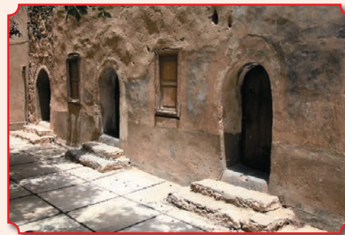
Кельи древних подвижников в монастыре святого Макария Великого

могли поместиться только два человека, причем высота, ширина и длина комнаты одинаковая – два метра. Голые глиняные стены, полочка для книг и больше ничего. Монастырским храмам более тысячи лет. Сохранились фрески и резной иконостас XI в.