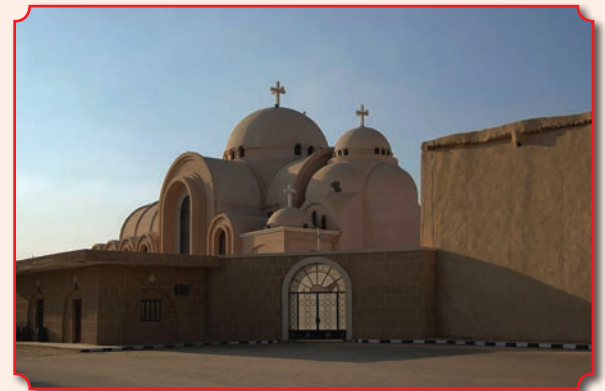
Монастырь святого Паисия Великого

Продолжая посещение египетских монастырей, стоит заглянуть и в монастырь Эль-Мухаррак, также известный как монастырь Мухаррак, монастырь Девы Марии, монастырь горы Коскам и др. Это один из древнейших монастырей мира, расположенный в центре Египта. После рождения Иисуса Святое семейство, со-