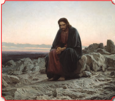
Иван Крамской. Христос в пустыне. 1872 г.

В 340 г. преподобный Харитон Исповедник основал здесь лавру Дука. Разрушенный при персидском нашествии в 614 г., монастырь святого Харитона восстанавливался и вновь разорялся, пока в 70-е гг. XIX в. здесь не поселился русский инок – «Аркадий», отшельник Сарандарский». Позже была восстановлена церковь в пещере Спасителя и устроен длинный ряд келий с внутренним коридором. Все внутренние помещения монастыря вырублены в скале. Храм обители двухпрестоль-