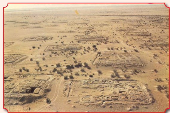
Фундаменты монашеских жилищ в общине Келлии

непрерывно действующих христианских монастырей в мире. Основан в IV в. в центре Синайского полуострова у подножия горы Синай (библейская гора Хорив) на высоте 1570 м. Укрепленное здание монастыря построено по приказу императора Юстиниана в VI в. Насельниками монастыря в основном являются греки православного вероисповедания. Первоначально именовался монастырем Преображения или монастырем Неопалимой Купины. С XI в., в связи с распространением почитания святой Екатерины Александрийской, мощи которой были обретыны синайскими монахами в VIII в., монастырь получил новое название – монастырь святой Екатерины. В 2002 году монастырский комплекс был включен ЮНЕСКО в список объектов Всемирного наследия. Известнейшим игуменом монастыря был прп. Иоанн Лествичник – автор «Лествицы», которую особо рекомендуется читать в Великий пост.