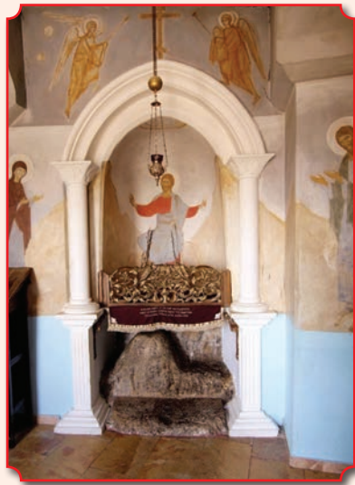
Камень, на котором молился Господь наш Иисус Христос

В 340 г. преподобный Харитон Исповедник основал здесь лавру Дука. Разрушенный при персидском нашествии в 614 г., монастырь святого Харитона восстанавливался и вновь разорялся, пока в 70-е гг. XIX в. здесь не поселился русский инок – «Аркадий», отшельник Сарандарский». Позже была восстановлена церковь в пещере Спасителя и устроен длинный ряд келий с внутренним коридором. Все внутренние помещения монастыря вырублены в скале. Храм обители двухпрестоль-