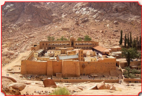
Монастырь святой Екатерины на горе Синай

непрерывно действующих христианских монастырей в мире. Основан в IV в. в центре Синайского полуострова у подножия горы Синай (библейская гора Хорив) на высоте 1570 м. Укрепленное здание монастыря построено по приказу императора Юстиниана в VI в. Насельниками монастыря в основном являются греки православного вероисповедания. Первоначально именовался монастырем Преображения или монастырем Неопалимой Купины. С XI в., в связи с распространением почитания святой Екатерины Александрийской, мощи которой были обретыны синайскими монахами в VIII в., монастырь получил новое название – монастырь святой Екатерины. В 2002 году монастырский комплекс был включен ЮНЕСКО в список объектов Всемирного наследия. Известнейшим игуменом монастыря был прп. Иоанн Лествичник – автор «Лествицы», которую особо рекомендуется читать в Великий пост.