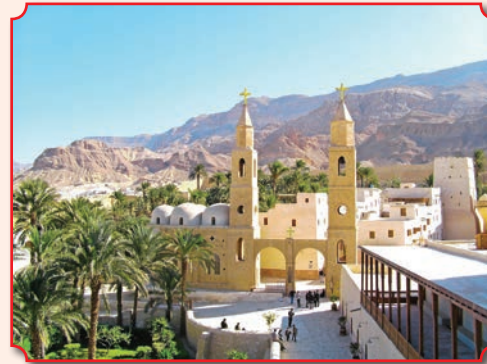
Монастырь святого Антония – древнейший христианский монастырь мира

мы можем ожить, когда мы отряхиваем с себя все, что в нас обветшало и омертвело, чтобы обрести способность жить со всей глубиной и интенсивностью, к которым мы призваны. Некоторые в Великий пост отравляются в паломничества. Однако большинство духовников сходятся во мнении, что полезнее это время провести, посещая свой приходской храм, внимая исполненным глубокой мудрости словам постового богослужения и не отвлекаясь на лишнее. А святые места своим мысленным взором можно посетить и на страницах «Православного Приднестровья».