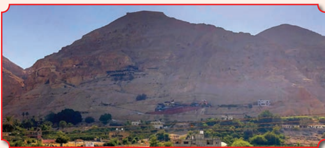
Сорокадневная гора (вид со стороны Иерихона)

Главная святыня монастыря Каранталь – камень, на котором, по преданию, молился Господь Иисус Христос. Здесь Ему явился диавол-искуситель и потребовал, чтобы Он превратил камни в хлеб, на что получил ответ: «Не хлебом единым жив человек». Тогда дьявол перенес Его на крышу храма и потребовал броситься вниз, «ибо написано: Ангелам Своим заповедает о Тебе, и на руках понесут Тебя, да не преткнешься о камень ногою Твоею». Однако Иисус