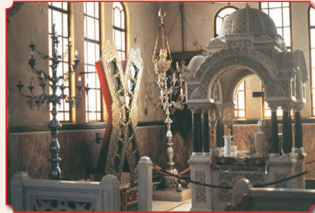
Крест-реликварий и престол правого придела Андреевского собора в Патрах (на престоле под мраморной сенью – глава апостола в серебряном ковчеге)

А в 1698 году Петром I был учрежден первый в России орден – орден Святого апостола Андрея Первозванного – для награждения за воинские подвиги и государственную службу.