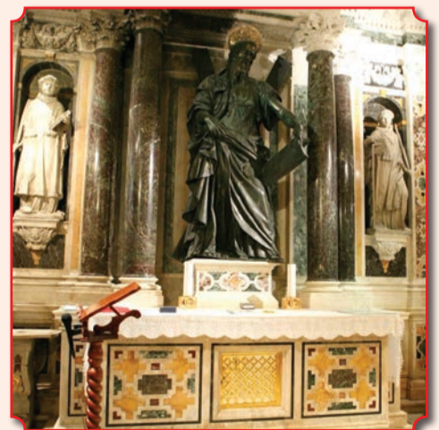
В крипте амальфийского собора под мраморным престолом хранится часть мощей апостола Андрея Первозванного

С древнейших времен существует традиция помещать часть святыни в изображение целого – в соответствии с верой в то, что она несет в себе благодать целого. Например, частицу мощей святого могут поместить в его изображение, иконное или рельефное. Так, часть главы апостола Андрея, пребывающая в Андреевском скиту на Афоне, почитается в ковчеге, украшенном скульптурным изображением лика апостола. При этом часть мощей – лобная кость – вставлена на свое анатомическое место. Кстати, ковчег этот украшен удивительными по