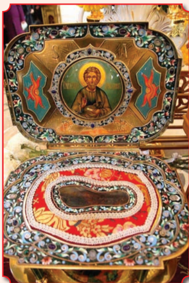
Ковчег с левой стопой апостола Андрея (Свято-Успенский мужской монастырь г. Одессы)

Вторая афонская часть мощей апостола Андрея Первозванного хранилась в также ранее бывшем русском ските Пророка Илии, но сегодня находится в Одессе, в монастыре Успения Пресвятой Богородицы. Мощи святого апостола отправились в путешествие с Афона в Российскую Импе-