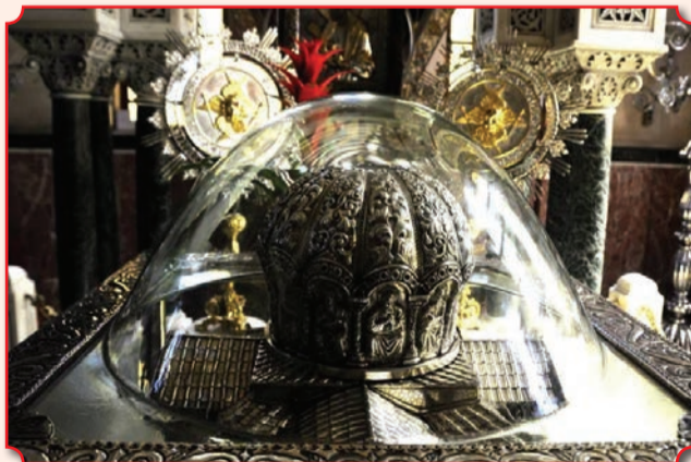
Глава апостола Андрея Первозванного в серебряном ковчеге на престоле Андреевского собора в Патрах