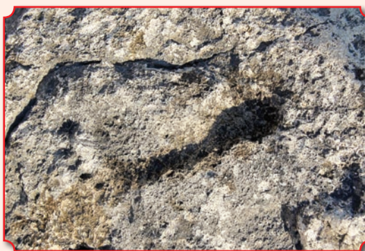
Отпечаток стопы апостола Андрея Первозванного в Херсонесе

чуда многие уверовали в слова апостольские и приняли святое Крещение.