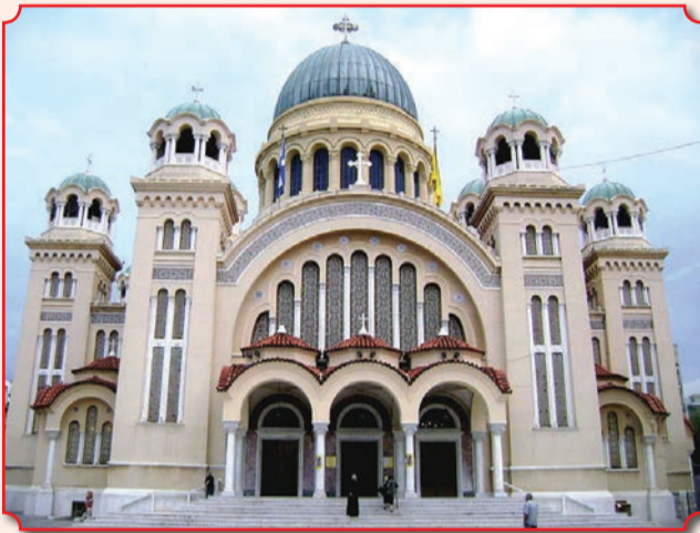
Собор Андрея Первозванного в городе Патры, построенный в 1836–1843 годах

В 1460 году Патры были захвачены войсками османского султана Мехмеда II. Фома Палеолог, деспот Морей, в 1462 году увез главу и частицы креста в Рим, где передал папе Пию II, поместившему их в соборе святого Петра. В 1964 году папа Павел VI передал главу Андрея Первозванного и частицы креста святого Андрея Элладской Православной Церкви, и эти реликвии торжественно возвратились на свое историческое место в Патры. Глава апостола находится в серебряном ковчеге в правом приделе храма, на престоле, под сенью из белого мрамора. Части креста святого Андрея вставлены в крест-реликварий, расположенный за престолом.