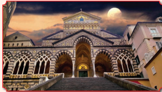
Грандиозный собор апостола Андрея в г. Амальфи (Италия)

кriptу под городским собором. Амальфийцы смогли получить лишь часть мощей, другие части разошлись по всему миру. Что-то забрали шотландцы в город Килримонт, который после этого был переименован в Сент-Эндрюс и стал церковной столицей Шотландии и всей Северной Европы (в 1559 году собор апостола Андрея был разрушен сторонниками Реформации, а его мощи были уничтожены). Еще часть попала в Ман-