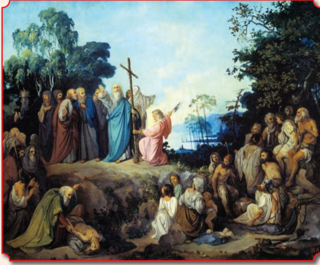
Николай Ломтев. Апостол Андрей Первозванный водружает крест на горах Киевских. 1848 г.

Священное Писание до нас весьма скудные сведения об апостоле Андрее. В Евангелии от Иоанна сказано о том, что во время чуда умножения хлебов он указал на мальчика, имевшего «пять хлебов ячменных и две рыбки» (Ин. 6, 8–9). Он же показал Спасителя язычникам, пришедшим в Иерусалим для поклонения истинному Богу (Ин. 12, 20–22). По свидетельству евангелиста Марка, святой Андрей был одним из четырех учеников Иисуса, которым Он на горе Елеонской открыл судьбы мира (Мк. 13, 3). С прочими апостолами в день Пятидесятницы в Иерусалиме он принял Святого Духа в виде огненных