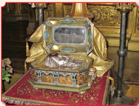
Мощевик с частью главы святого апостола Андрея Первозванного

рию вместе с игуменом скита преподобным Гавриилом Афонским (1849-1901). Для строительства нового кафедрального собора отцу Гавриилу нужны были средства, поэтому в конце 1893 года он отправился с чудотворной иконой Божией Матери Млекопитательница и частицей мощей святого апостола Андрея в Россию. После смерти старца в 1901 году святые так и не вернулись в Ильинский скит, который известен еще и тем, что в 1757 году в нем поселился преподобный Паисий Величковский. А хранившаяся в Ильинском скиту и ныне пребывающая в Одессе стопа святого апостола Андрея в январе 2006 года, как могут помнить многие наши читатели, посетила Тираспольско-Дубоссарскую епархию.