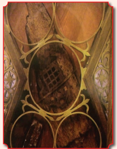
Крест-реликварий с частями креста апостола Андрея