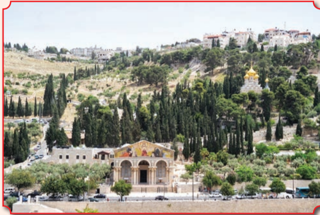
Общий вид на Гефсиманию, Елеонскую гору, долину Кедрон (на переднем плане), католическую церковь Всех Наций и православную церковь Марии Магдалины

столь великими событиями из жизни Спасителя, это место, по свидетельству предания, стало любимым местом посещения и молитвы и Его Пречистой Матери. Здесь Она вновь и вновь душой Своею переживала те события из жизни Своего Божественного Сына, которые, как меч, пронзили Ее душу. Здесь Она и почилла сном смерти и нашла временное Свое успокоение» (проф. М. Н. Скабалланович, «Успение Пресвятой Богородицы»).