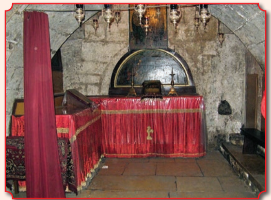
Придел святых Иоакима и Анны, справа от лестницы, с престолами прав. Иоакима и прав. Анны

на мраморной в пол каменной плите. Престол в честь святого Иоакима – у восточной стены придела (по преданию, он похоронен под этим престолом). Престол в честь святой Анны – у северной стены придела (по преданию, она также похоронена под ним). Придел праведного Иосифа Обручника – слева при спуске, примерно в середине лестницы, с 1814 года принадлежит армянам. В приделе находится армянский престол в честь праведного Иосифа Обручника, под которым, по преданию, он и погребен. Еще в храме расположены два православных престола – в честь святого первомученика Стефана (сразу при спуске с лестницы на правой стороне у стены) и святителя Николая (в северной части храма), второй армянский (пристроен снаружи к западной стене кувуклии, слева от входа в нее), сиро-яковитский (около северного выхода из кувуклии, в особом небольшом приделе) и коптский (в западной части церкви).