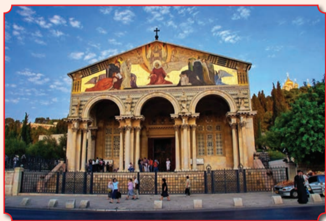
Католическая церковь Всех Наций, или Базилика Страстей Господних (лат. Basilica Agoniae Domini)

Само название Гефсимании (на арамейском оно звучит как «гат шамна») означает буквально «масличный пресс, место для выдавливания масла». В евангельские времена так называлась вся долина, лежащая у подошвы Елеонской горы. Сохранившийся до наших дней Гефсиманский сад весьма мал (47 Ч 50 м), хотя в древности вся Гефсимания была садом, растут же в нем восемь очень древних оливок. Исследование, проведенное Национальным Исследовательским Советом Италии в 2012 г., показало, что некоторые из них относятся к числу древнейших известных науке.