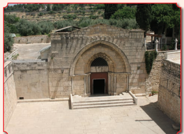
Церковь Успения Пресвятой Богородицы в Гефсимании, фасад XII века

Главная святыня Гефсимании – Гробница Богородицы – находится в пещерном храме Успения Пресвятой Богородицы, у подножия западного склона Елеонской горы. Согласно церковному преданию, Успение Пресвятой Богородицы свершилось в Иерусалиме на горе Сион. Апостолы похоронили Ее в Гефсимании, где находилась гробница Ее родителей Иоакима и Анны, а также гробница Иосифа Обручника. Хотя апокриф «Сказание об успении Святой Богородицы», написанный не ранее IV века, сообщает, что Богородица была похоронена апостолами «в Гефсимании в новом гробе». Отсутствующий при погребении апостол Фома пришел через три дня в Гефсиманию и попросил открыть гроб, чтобы проститься с Матерью Божией, но открытый гроб оказался пустым.