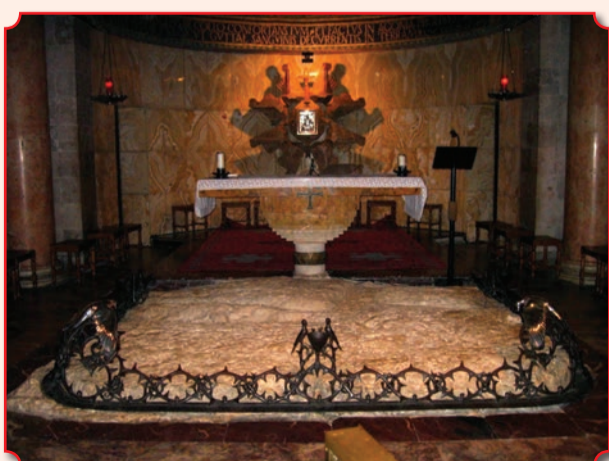
Согласно преданию, на этом камне Иисус Христос совершил Моление о чаше (на заднем плане – престол церкви Всех Наций)

Гефсиманский сад почитается как одно из мест, связанных со Страстями Христовыми, и является местом регулярного па-