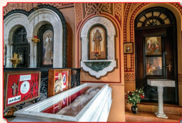
Рака с мощами св. прмц. вел. кн. Елисаветы в церкви равноап. Марии Магдалины