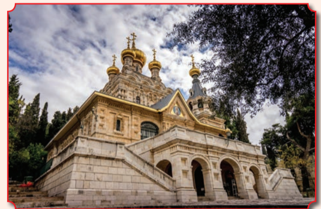
Церковь святой равноапостольной Марии Магдалины в Гефсимании

Церковь святой Марии Магдалины была построена Императорским Православным Палестинским Обществом на средства императорской семьи в память об императрице Марии Александровне. С 1921 года в