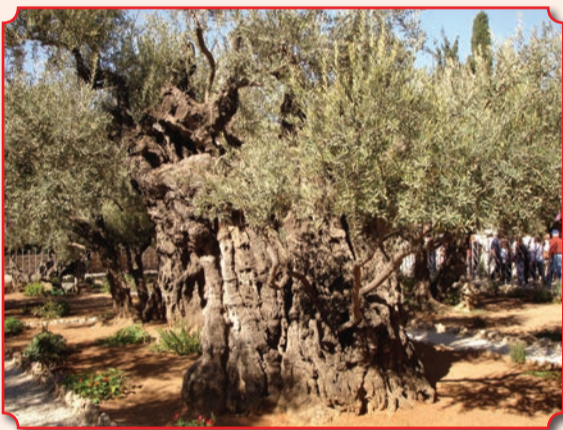
Одна из восьми древних оливок Гефсиманского сада

Гефсиманский сад был излюбленным местом Христа, куда Он удалялся для уединенной беседы со Своими учениками и для молитвы (Лк. 22:39, Ин. 18:2). «Здесь же, у подножия священного города, в тени оливковых деревьев, в глубокой тишине, в одиночестве и смертельной тоске Спаситель мира провел и последнюю Свою ночь на земле – ночь невыразимых душевных страданий и молитвы к Отцу до кровавого пота. Здесь в эту ночь, покинутый друзьями, Он лобзанием ученика был предан врагам и ими схвачен для осуждения на смерть. Запечатленное