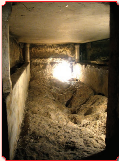
Каменное ложе Богородицы в кувуклии (под православным престолом)

запада, второй с севера. Обычно паломники заходят через западный, а выходят через северный вход. За кувуклией, в восточной части храма, находится почитаемая чудотворной Иерусалимская икона Божией Матери русского письма, которая помещена в киот из розового мрамора. Основной объем храма имеет размер примерно 34 метра в длину, с востока на запад, и 6 метров в ширину, с севера на юг. Лестница, ведущая в храм, имеет ширину примерно 6,5 метров.