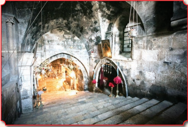
Лестница, ведущая вниз от входа в храм Успения Пресвятой Богородицы (справа вход в придел святых Иоакима и Анны)

Первое письменное упоминание о церкви на этом месте датируется VI веком, когда над Гробницей Богородицы была построена круглая церковь императором Мавриkiem Тиберием. Храм был разрушен персами в 614 году. Затем церковь была перестроена и стала иметь два уровня. В VII веке Гробница Богородицы была вскрыта по решению VI Все-