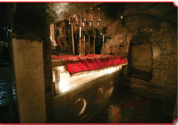
Гробница Богородицы, вид от северного входа в кувуклию (красным покрывалом покрыт православный престол, установленный над священным ложем)