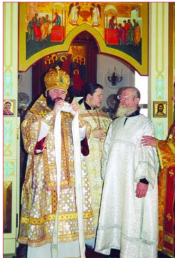
Преображенском соборе г. Бендеры, а на полиелей вышел в Покровской церкви г. Тирасполь. ***

Вечером того же дня перед началом богослужения епископ Тираспольский и Дубоссарский Юстиниан с собором духовенства совершил чин освящения новосозданной росписи алтаря Христо-Рождественского кафедрального собора г. Тирасполь. ***