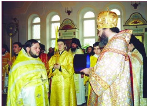
Иосиф в честь праведного Иосифа Обручника. ***