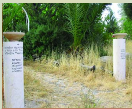
Место, где стояли апостолы при Вознесении (монастырь св. Пелагеи)