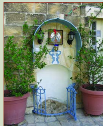
Место, где стояла Божия Матерь при Вознесении

Вот почему радуются и ликуют апостолы на Елеонской горе, вот почему в празднике Вознесения Господня нет ни малейшей частицы печали, так свойственной всякому расставанию. Беседуя со Своими учениками накануне Голгофских страданий, Господь наш Иисус Христос сказал апостолам удивительные слова: "Истинно, истинно говорю вам: вы восплачете и возрыдаете, а мир возрадуется; вы печальны будете, но печаль ваша в радость будет; женщина, когда рождает, терпит скорбь, потому что пришел час ее, но когда родит младенца, уже не помнит скорби от радости, потому что родился человек в мир; так и вы теперь имеете печаль; но Я увижу вас опять, и возрадуется сердце ваше, и радости вашей никто не отнимет у вас..." (Ин. 16, 20-22). Понесем же и мы с собою в наши дома и семьи, к друзьям и знакомым в обезбуженный мир эту апостольскую радость, которую никто не сможет отнять.