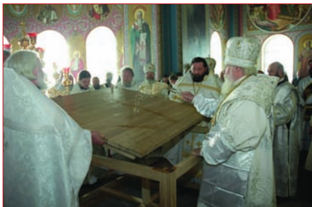
Освящение Преображенского собора Спасо-Преображенского Валаамского монастыря

В нынешнем году, в числе других происшедших радостных событий, продолжалось и возрождение святынь, в прежние годы бывших излюбленными местами паломничества. Сколько благочестивых душ наших предков приходили сюда за утешением, благословением, вразумлением! Сколько выдающихся имен и судеб связаны со святыми обителями!