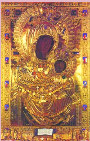
Иверская икона Божией Матери, которая находится на Афоне

25 февраля - праздник Иверской иконы Божией Матери