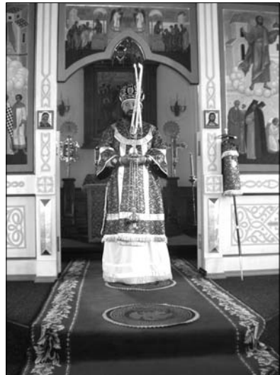
Свет Христов просвещает всех! Сщмч. Серафим (Чичагов)

Посмотрите, как одновременно вера в Воскресшего отверзает ум апостолов и неверие в Воскресшего заключает ум иудеев в глубокую тьму. Что говорили и что думали иудеи о Воскресении Христа? Старейшины учили воинов сказать, что ученики Христовы, пришедши ночью, украли Его, когда они спали. И пронеслось слово сие между иудеями до сего дня (Мф. 28, 13-15). Как можно было украсть Христа, когда старейшины окружили гроб воинами? Они спали, говорят иудеи. Военные стражи спали? Так, по мнению иудеев. Неужели все до одного? Неужели ни один не проснулся, когда для похищения тела необходимо было отвалить камень велий зело, для чего потребно было несколько человек и что не могло совершиться без шума! Ни один не проснулся. Но кто же свидетельствует о том, что тело украли? Те же стражи, которые спали и не проснулись, свидетельствуют о том, что произошло во время сна их и чего они не слышали. Но если сделано известно, что совершенно похищение из-под печати правительства и похитители известны, то преданы ли суду стражи и похитители? Отнюдь нет. Возможно ли, чтоб и после этого сочиненная басня о похищении тела Иисусова существовала? Возможно, потому что законный в неверии ум, говорит святитель, как ночная птица, видит только во тьме и убегает от света истины, который жжет ему глаза.